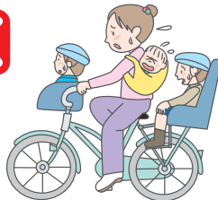
幼児2人同乗用自転車、未就学児2人、4歳未満の幼児をひも等で確実に背負う場合