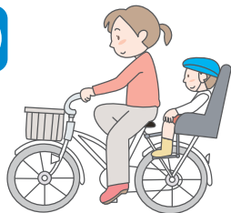
普通の自転車、未就学児1人