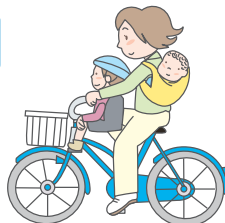
普通の自転車、未就学児1人、4歳未満の幼児をひも等で確実に背負う場合